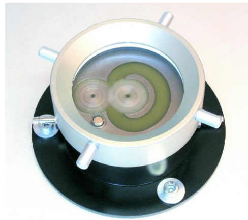
Zahnradpumpe mit kurzgeschlossenem Kanal

(Die tatsächliche Ausführung kann von der Abbildung abweichen)