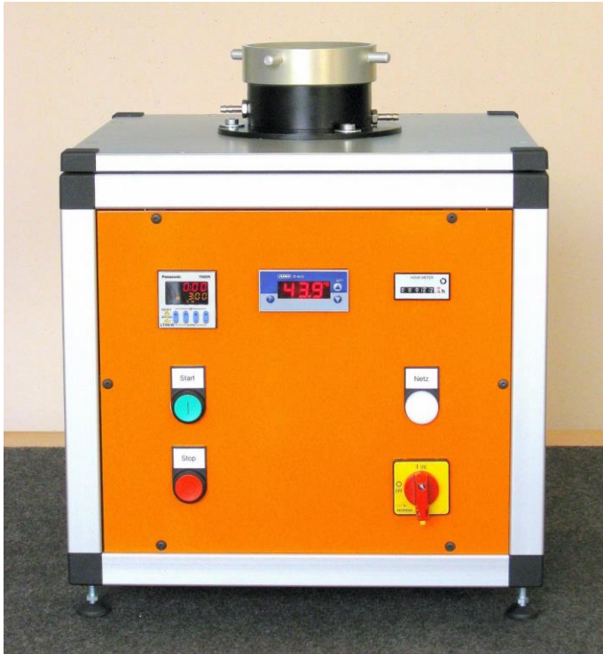
Walkapparat - Frontansicht

(Die tatsächliche Ausführung kann von der Abbildung abweichen)